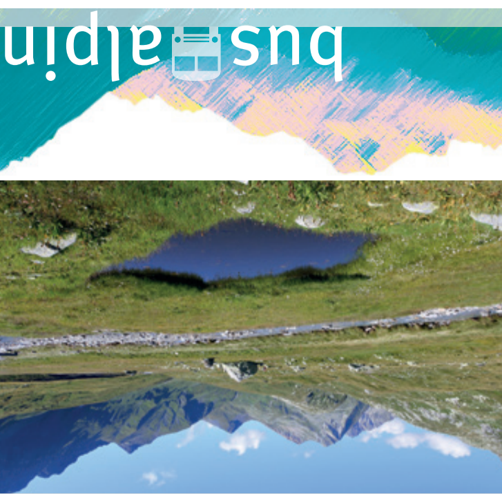
Valle di Blienio – Sumvitg – Val Lumnezia